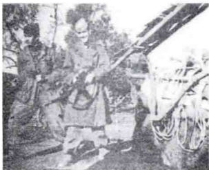
— المؤلف مع أحد المجاهدين