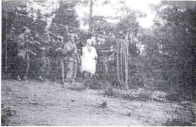
تمثيلية من تأليف وآداء الشهيد أحمد أرسلان (شاعر الثورة و مرشد الولاية) بمناسبة إحياء ذكرى اندلاع الثورة في 1 نوفمبر 1959 م في قرية أولاد بوعشرة.