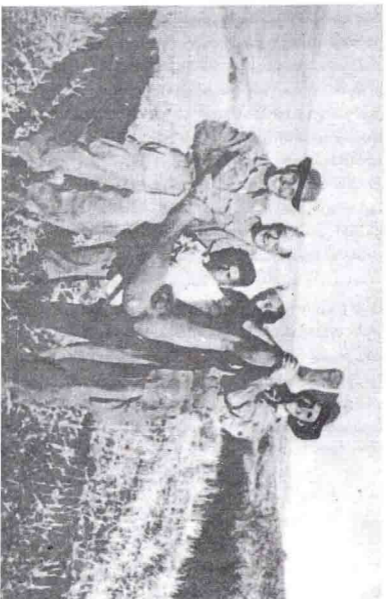
صورة كان يرسلها جنود الاحتلال إلى عائلاتهم عثرنا عليها لدى جندي فرنسي اعتقل في كمين سنة 1958 (التقطت الصورة في جويلية 1958 بأولاد هلال).