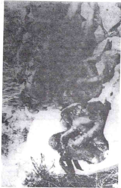
أكثر من 110 مواطن أحرقتهم فرنسا بالنابالم سنة 1959 بالولاية الرابعة. (التقطت الصورة في منطقة تنس)