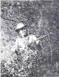
المجاهد صادق بطل أول وزير للشباب والرياضة سنة 1962