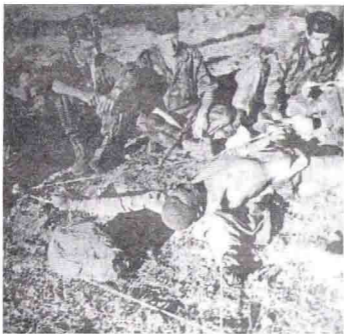
صور لفرج من المظليين، وهم يعذبون المواطنين في نواحي مليانة.