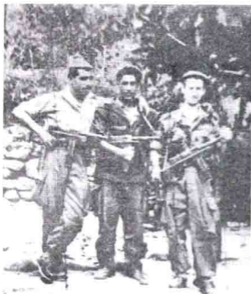
المؤلف (على اليسار) مع طهراوي، و بابا علي.